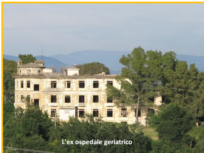
L'ex ospedale geriatrico

Da allora l'affascinante struttura novecentesca, che versa in uno stato di