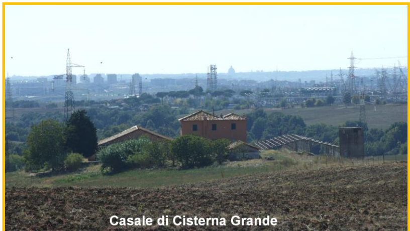
Casale di Cisterna Grande

Fulcro e forza motrice trainante del progetto é la riqualificazione e l'apertura al pubblico dell'area archeologica di Crustumerium: città che visse il suo massimo splendore tra l'XI e il VI sec. a.C. e dove l'insediamento, già nella prima età del ferro (X – IX sec. a.C.), occupava una superficie di 60 ettari. A tale scopo fondamentale é la realizzazione nel Casale di Cisterna Grande, già proprietà della Sovrintendenza, di un museo che permetterebbe finalmente di esporre al pubblico, reperti di notevole valore, unici nel loro genere, come anfore, tazze e vasi dalle fatture singolari, riportati alla luce in questi anni, nel corso degli scavi archeologici nelle necropoli di Monte Del Bufalo e Sasso Bianco.