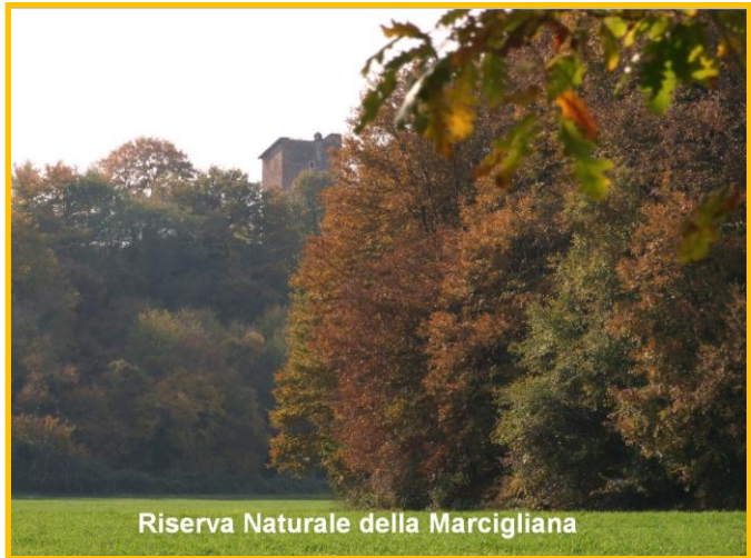
Riserva Naturale della Marcigliana

Il programma connesso all'idea sviluppata dal Coordinamento nella "Proposta di Rete Ciclopedonale III Municipio" ( http://www.organizzaaionealfa.it/wpcontent/uploads/2011/10/proposta-di-rete-ciclopedonale-del-IV-Municipio.pdf ), vuole essere un'azione pilota mirata a favorire la rigenerazione ecologica ambientale ed urbana attraverso la progettazione partecipata di azioni per la trasformazione e lo sviluppo eco – sostenibile del Municipio III.